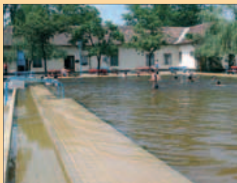
A kerekestelepi fürdő vonzereje a 3,3 hektáros park növényeiben rejlik

Vízforrató híján is kinyithat a Kerekestelepi Strand, mivel idén még haladékos kaptak az EU-normát nem teljesítő fürdők.