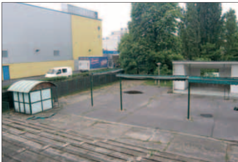
A „tetszhalál” után alapos felújítás szükséges

lesz náluk például két koncert és két ifjúsági találkozó is. Ez utóbbiak egyikét hat hitközség rendezi.