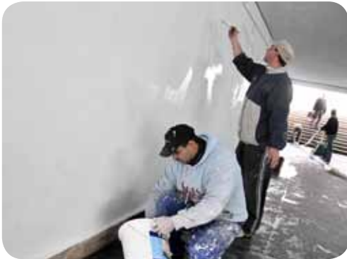
Ismét ki kellett meszelni a Petőfi téri aluljárót