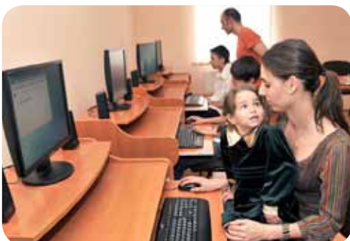
Szolgáltató központot alakított ki a Szeta

■ SZÖKŐKUTAK. Megkezdődött a Kossuth téri látványsszökőkút téli védőfalának elbontása. A szükséges ellenőrzések után üzembe is helyezték a vizes látványosságot. Ezzel párhuzamosan folyamatosan beindították a Piac utca 16. szám előtti, a Petőfi és az Egyetem