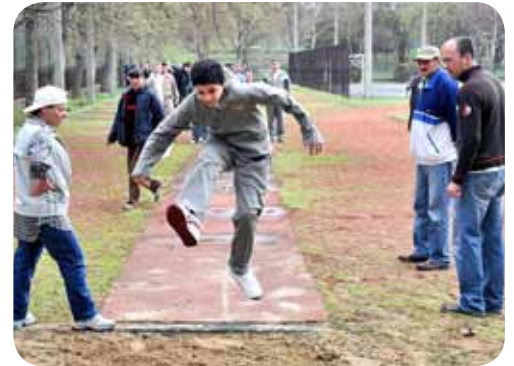
Öröm volt a mozgás!

■ SZEGÉNYEK. Új szolgáltatásokat indított a Debreceni Szegényeket Támogató Alapítvány (Szeta). A szervezet fő feladata a leginkább hátrányos helyzetű emberek segítése. A Szeta (és konzorciumi partnere, a CSAT Egyesület) sikeresen szerepelt az Észak-alföldi Operatív Programban. A Gene-Ráció című EU-pályázat révén komplex munkaerőpiaci és közösségfejlesztő programok segítik